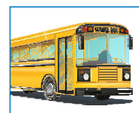
Ir al autobús