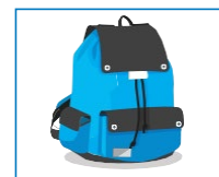
Tomar la mochila